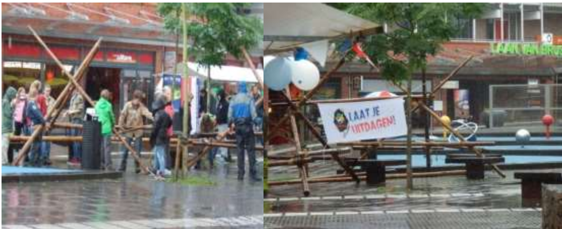
De Scouts hard aan het werk voor de opbouw. De meiden staan duidelijk hun mannetje