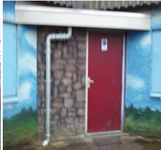
Het vernieuwde afdakje