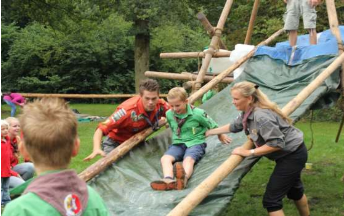
Een Welp vliegt over naar de Scouts