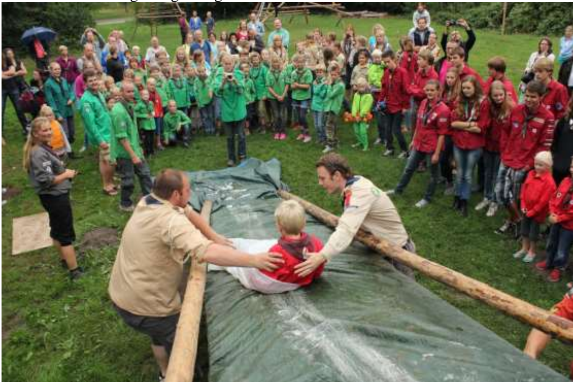
Overvliegen. Een Bever glijdt naar de Welpen zijn nieuwe speltak.

In september was het jaarlijkse overvliegen, waarbij de oudste leden van iedere speltak via een obstakel, in dit geval een glijbaan en voor de oudere leden een vakwerk V-brug en kabelbaan, symbolisch overvliegen naar de volgende speltak. Mede dankzij het mooie weer was het een zeer geslaagde dag.