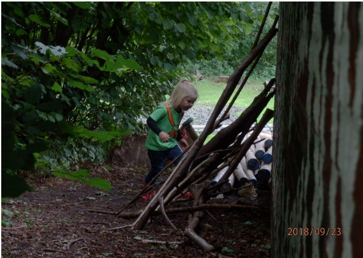
De appel valt niet ver van de boom

De uitbouw van het clubhuis gaat niet door wegens het ontbreken van voldoende financiële middelen, maar het ruimte gebrek blijft. Het idee is nu om een container te plaatsen waarin we minder frequent gebruikte materialen op kunnen slaan, waardoor er in de lokalen en store ruimte vrijkomt. Het is de bedoeling om het dak aan de grasveldzijde te vervangen door een zelfde soort dak, inclusief isolatie, als aan de fietspadzijde. Bovendien wordt het platte dak geïsoleerd en van een nieuwe bedekking voorzien. Voorbereidingen worden getroffen om alle TI's en een aantal bestuursleden van de groep- en stichting van vaste emailadressen te voorzien. Bij vertrek van een leiding of bestuurslid blijft het emailverkeer beschikbaar voor zijn of haar opvolger. In 2019 zal een bestuurslid worden benoemd als AVG functionaris.